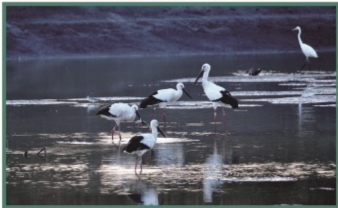
심원면 고전리 산24-14앞