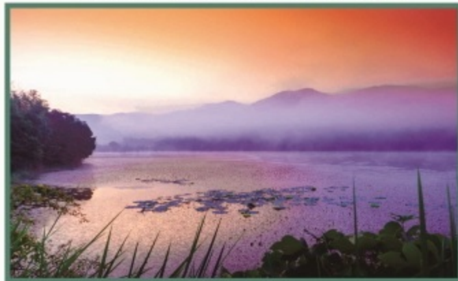
고창군 아산면 운곡서원길 15 (운곡습지)