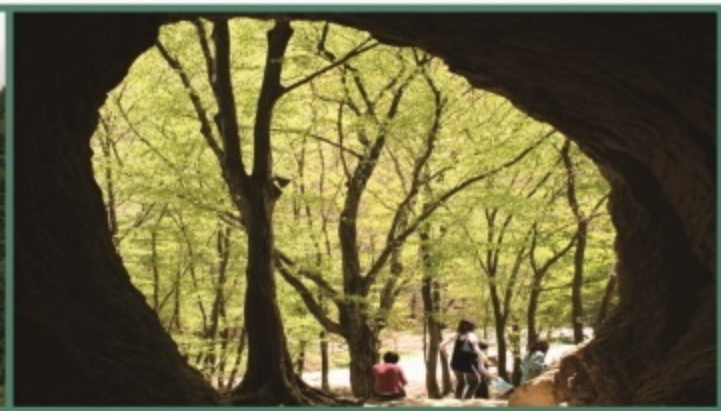
아산면 삼인리 산 97 (선운산 진흥굴)