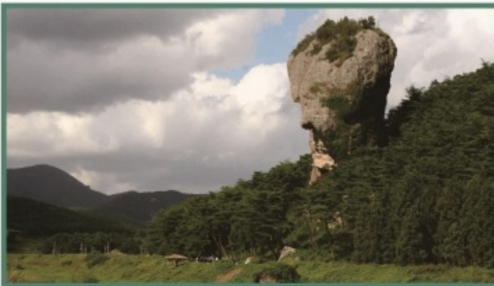
아산면 반암리 산 16 (병바위)