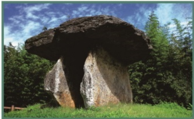
고창읍 고인돌공원길 74 (고인돌박물관)