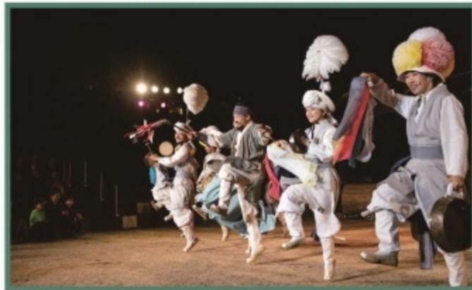
성송면 향산1길 106 (고창농악전수관)