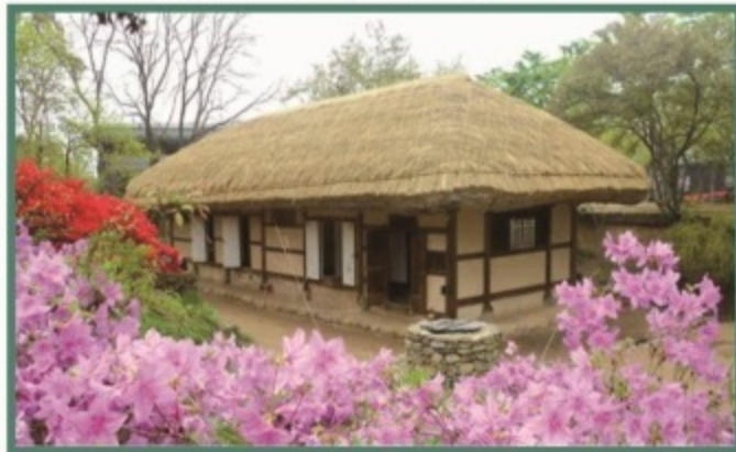
고창읍 동리로 100 (신재효고택)